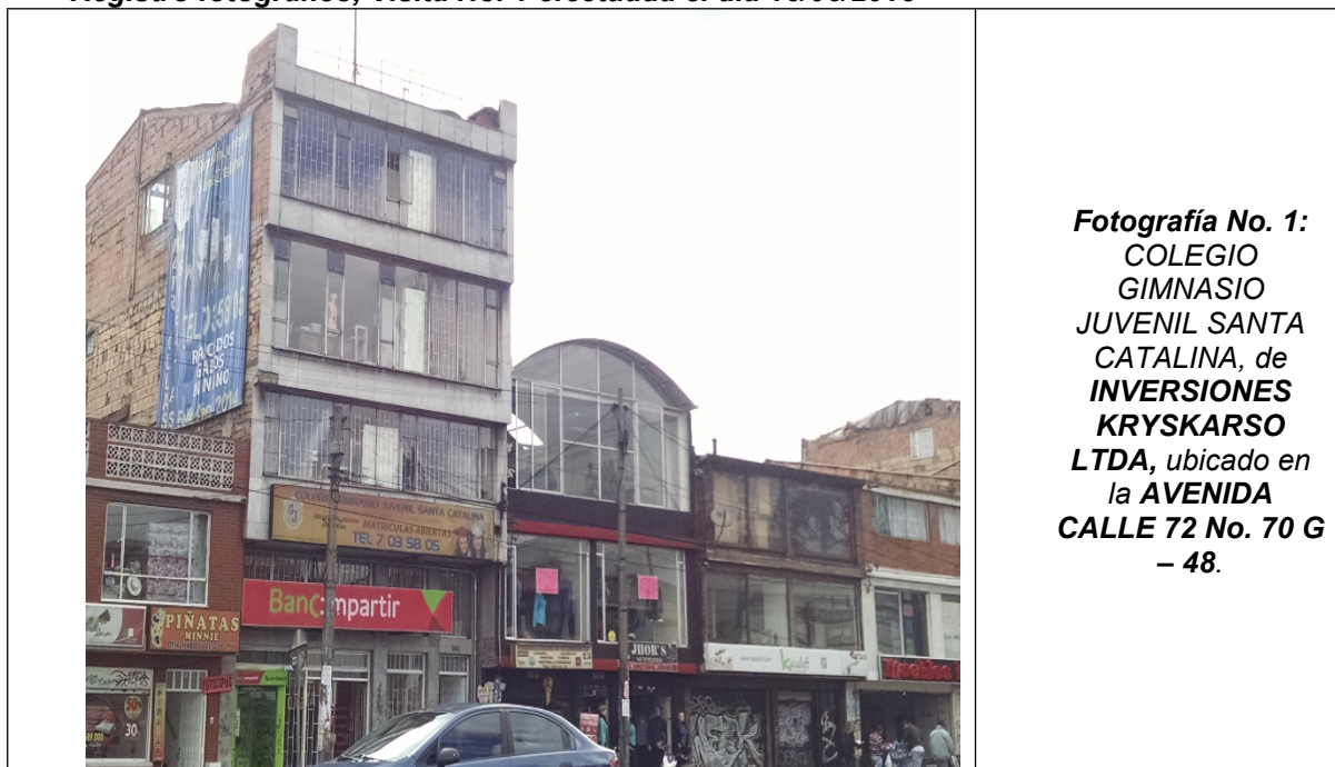
Fotografía No. 1: COLEGIO GIMNASIO JUVENIL SANTA CATALINA, de INVERSIONES KRYSKARSO LTDA , ubicado en la AVENIDA CALLE 72 No. 70 G – 48.

Registro fotográfico, Visita No. 1 efectuada el día 16/06/2015